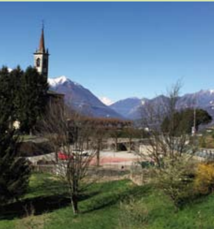
Chiesa della Madonnina, Vendrogno

sasso, si supera dolcemente il dislivello osservando panorami sempre più ampi, dall'acqua increspata del lago ai verdi boschi distesi sui fianchi dei monti, alle cime rocciose dominanti le ben definite sponde; si attraversano diverse fasce di vegetazione determinate dalla temperatura, dapprima i tigli, poi faggi, castagni, abeti, betulle, pascoli e molte essenze floreali; si incontrano i nuclei storici abitati raccolti in sei frazioni e cinque alpeggi dove l'uomo, ancora, fa vivere la naturalità dell'ambiente trasformando l'erba in carne e formaggio, i frutti in dolci e marmellate, i fiori in miele e offrendo i prodotti in molte e semplici strutture ricettive.