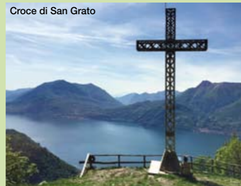
Croce di San Grato

sasso, si supera dolcemente il dislivello osservando panorami sempre più ampi, dall'acqua increspata del lago ai verdi boschi distesi sui fianchi dei monti, alle cime rocciose dominanti le ben definite sponde; si attraversano diverse fasce di vegetazione determinate dalla temperatura, dapprima i tigli, poi faggi, castagni, abeti, betulle, pascoli e molte essenze floreali; si incontrano i nuclei storici abitati raccolti in sei frazioni e cinque alpeggi dove l'uomo, ancora, fa vivere la naturalità dell'ambiente trasformando l'erba in carne e formaggio, i frutti in dolci e marmellate, i fiori in miele e offrendo i prodotti in molte e semplici strutture ricettive.